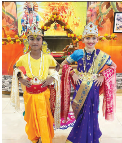
पार्ले टिळक विद्यालय मराठी माध्यमिक विभाग