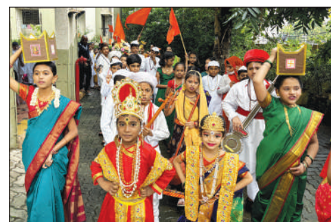
PTVA's EMS, Andheri