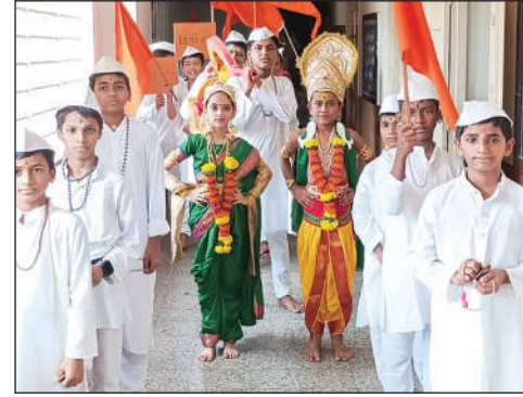
परांजपे विद्यालय माध्यमिक शाळा