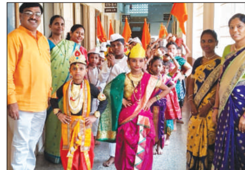
परांजपे विद्यालय प्राथमिक विभाग, अंधेरी