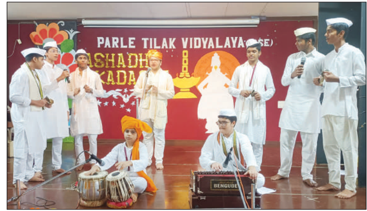
PTV (ICSE) - Secondary

गुशब्दस्वन्धकारः स्यात् रुशब्दस्तन्निरोधकः ।