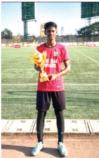
PTVEMS' secondary section won runner up title in the same tournament.

20 best football players from Maharashtra who performed well in this tournament have been selected by the Sports Director, Mr. Brosmer of FC Bayern. These players will be given special training in Munich, Germany.